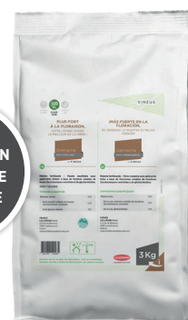
1 sac de 3 kg