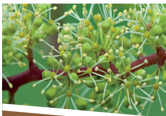
GRENACHE ANTI COULURE